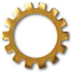
DIN 6797 A