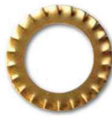
DIN 6798 A