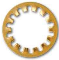
DIN 6797 J