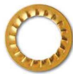
DIN 6798 J